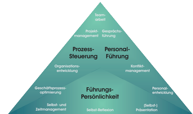
Abb. 2: Themenfelder von „In Zukunft führen“ - Basis- und Aufbaukurs

Vermittelt Kompetenzen zur Organisationsentwicklung, vertieft Kompetenzen der Personalführung und unterstützt die Entwicklung der Führungspersönlichkeit. Dauer: ca. 1,5 Jahre Umfang: 8 halbtägige Workshops, 5 Seminartage, 3 individuelle Coachings, zzgl. ca. 12 Std. individuelle Lernzeit monatlich